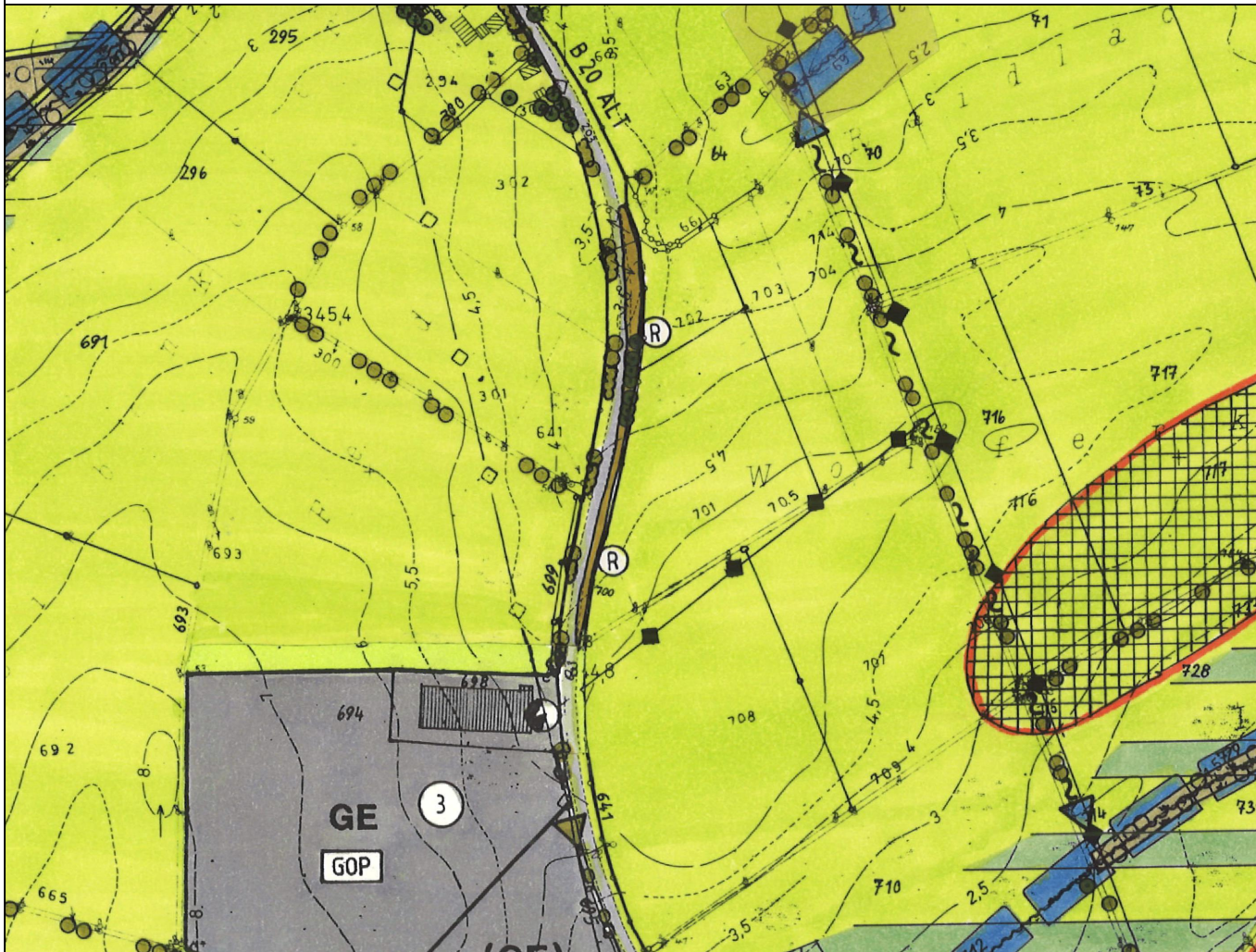
DECKBLATT NR. 26